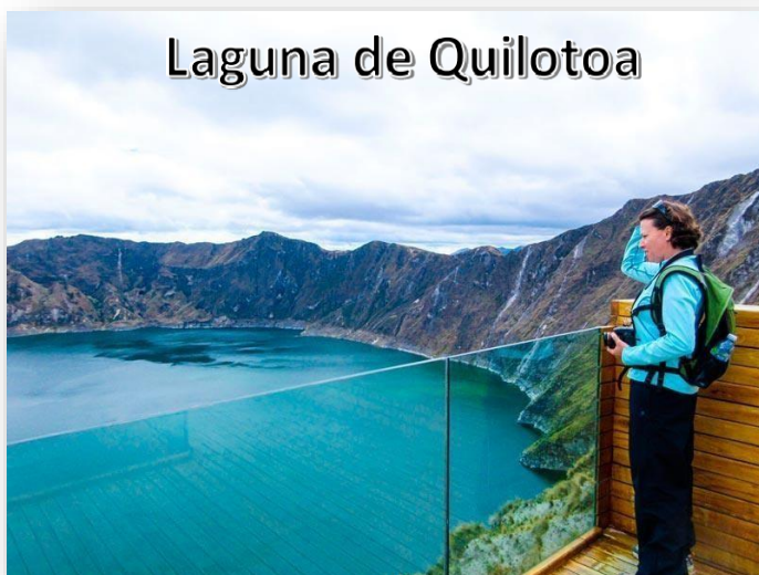
Laguna de Quilotoa